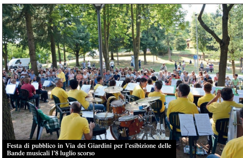
Festa di pubblico in Via dei Giardini per l'esibizione delle Bande musicali l'8 luglio scorso

Anche la nuova location scelta per il "Concerto d'estate 2018" è stata molto gradita. L'area verde di Via dei Giardini, riempita domenica 8 luglio delle note della Banda musicale del Roero, della Filarmonica di Narzole e della Banda Città di Cherasco è stata apprezzata, perché facilmente raggiungibile da chi avrebbe avuto difficoltà a recarsi nel Parco forestale. Anche questo esperimento verrà ripetuto, magari migliorandolo. Le due iniziative sono perfettamente riuscite perché si sono unite le forze: Centro culturale, Pro Loco, Comune, Roero Verde, Mondogiovani, Carabinieri