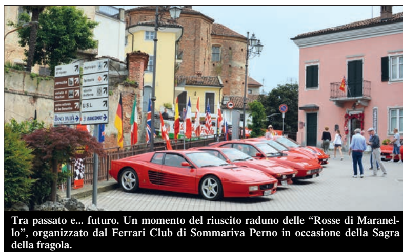
Tra passato e... futuro. Un momento del riuscito raduno delle "Rosse di Maranello", organizzato dal Ferrari Club di Sommariva Perno in occasione della Sagra della fragola.