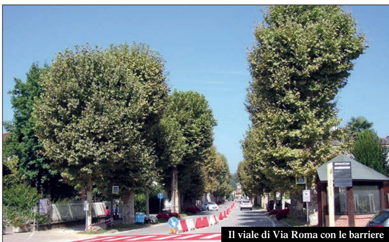
Il viale di Via Roma con le barriere

Troppi continuano a prendere il viale come una pista di F1. Per venire incontro alle sempre più pressanti richieste degli abitanti e degli esercenti di Via Roma, l'Amministrazione ha perciò pensato a un esperimento: ridurre l'attuale carreggiata con l'inserimento di new jersey per creare, oltre all'ostacolo fisico, un effetto visivo per rallentare la velocità e uno effettivo per impedire i sorpassi. L'esperimento è stato autorizzato dalla Provincia, proprietaria e responsabile della strada, fino al prossimo 15 settembre (i new jersey saranno tolti prima di Santa Croce) e poi si trarranno i risultati. Positivi, negativi? Si vedrà. Intanto, si avrà una base di partenza e di confronto per una discussione che dev'essere tecnica e serena, non "a prescindere". Solo dopo si prenderanno decisioni e si assumeranno iniziative per eliminare (impossibile...) o comunque attutire un problema che sta da sempre a cuore all'Amministrazione, che finora ha evitato i più comodi autovelox, che fanno cassa, ma non educazione. Se però sarà necessario, si studierà anche questa soluzione, anche se non è così semplice ottenere l'autorizzazione ad installarli.