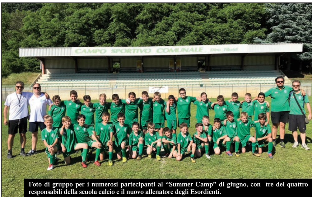
Foto di gruppo per i numerosi partecipanti al "Summer Camp" di giugno, con tre dei quattro responsabili della scuola calcio e il nuovo allenatore degli Esordienti.