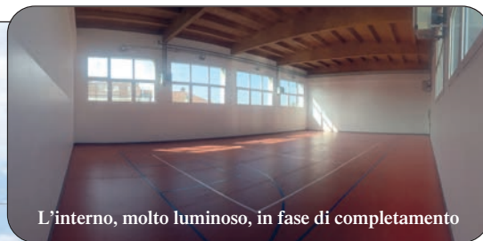
L'interno, molto luminoso, in fase di completamento