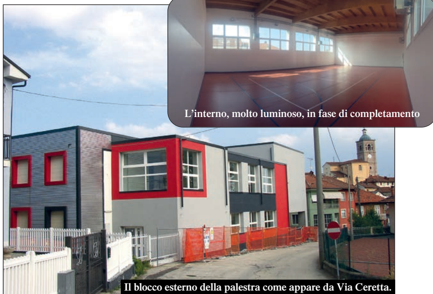
Il blocco esterno della palestra come appare da Via Ceretta.

Anno scolastico nuovo, palestra nuova. E' sicuro. Dal 10 settembre, data di inizio delle scuole, gli alunni delle elementari e medie potranno utilizzare i nuovi locali costruiti in sostituzione della vecchia palestra degli anni '60. Insegnanti ed allievi non dovranno più "inventarsi" spazi per l'attività fisica e sottoporsi a continue "migrazioni" verso il Centro Sportivo. Intanto continueranno i lavori di finitura interna e di sistemazione completa del cortile (diventerà una grande area verde) che, affidati allo Studio Cornero e già deliberati dalla Giunta lo scorso 9 agosto per un importo di € 53.000, si prevedono conclusi entro l'anno per ridare finalmente all'intero complesso di Via San Giovanni la sua dignità di edificio scolastico e una forma moderna, vivace, soprattutto "giovane".