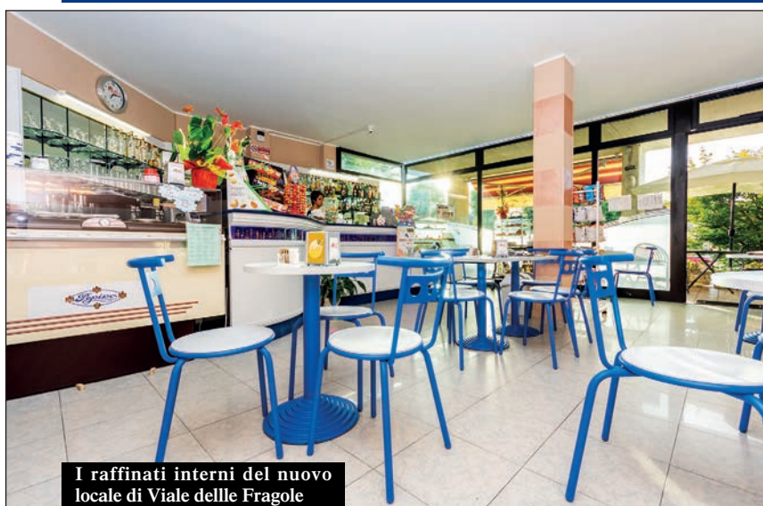
I raffinati interni del nuovo locale di Viale delle Fragole