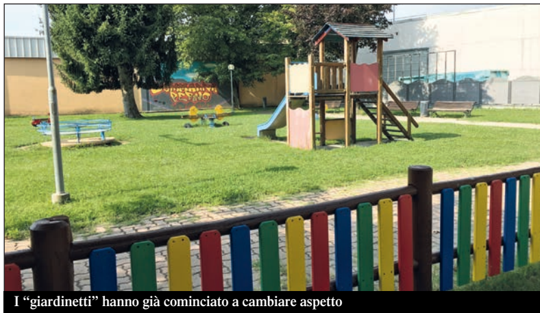
I "giardinetti" hanno già cominciato a cambiare aspetto

Il vecchio giardinetto lungo il viale della Bocciofila ha i giorni contati. Salvo imprevisti, infatti, entro settembre (ma si spera già per Santa Croce) l'area-bimbi attrezzata, creata nel lontano 1999 e mantenuta "all'onore del mondo" per tutti questi anni, sarà completamente rifatta e riqualificata. Grazie ad un contributo di € 13.600 assegnato sul bando "Parchi gioco e Spazi verdi" della Fondazione CRC, integrato ovviamente con fondi del bilancio comunale fino all'importo totale previsto in € 40.000 circa, Iva compresa, si interverrà sui giochi esistenti recuperabili, eliminando quelli non più recuperabili e sostituendoli con l'inserimento di nuovi giochi, alcuni accessibili anche a bambini con disabilità.