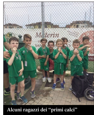
Alcuni ragazzi dei "primi calci"