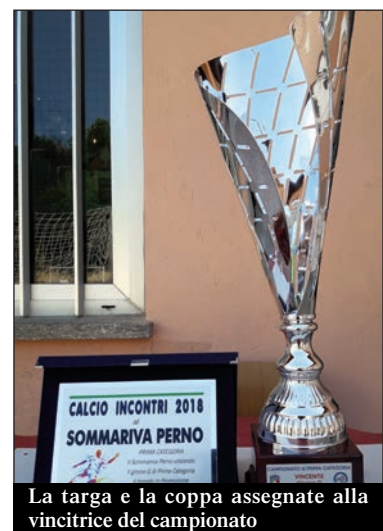
La targa e la coppa assegnate alla vincitrice del campionato