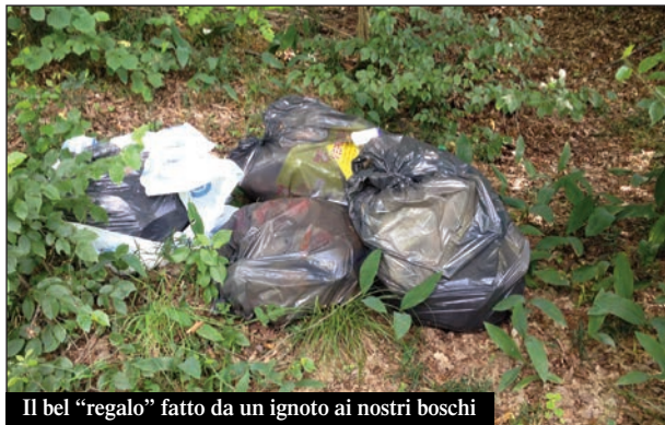
Il bel "regalo" fatto da un ignoto ai nostri boschi

Non un'installazione di arte contemporanea o un "impacchettamento" di Christo, ma un ben più prosaico, e brutto, cumulo di spazzatura che un animo gentile ha pensato bene di "donare" alla collettività: questo ha trovato chi intorno al 23 giugno ha avuto modo di percorrere la sterrata che dal tiro al piattello va verso il parco forestale del Roero. Non deve essere stato facile ammucciare rifiuti di vario genere, riempire 3 o 4 sacchi neri tipo condominio, caricarli in auto o su un rimorchio, uscire dal paese, fare circa 3 Km su strada sterrata per poi depositare il tutto al limitar del bosco. A occhio e croce si fa prima a selezionare in casa giorno per giorno, usufruire della raccolta a domicilio (due volte la settimana) e per gli ingombranti recarsi a Casà o a Pocapaglia. Mah. Misteri della mente umana!