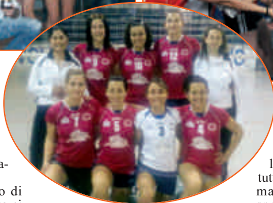
La squadra delle "Open", che andrà ai Nazionali

Anche quest'anno tra allenamenti e partite, campionati e tornei, vittorie e sconfitte è arrivata al termine un'altra stagione di pallavolo a Sommariva.