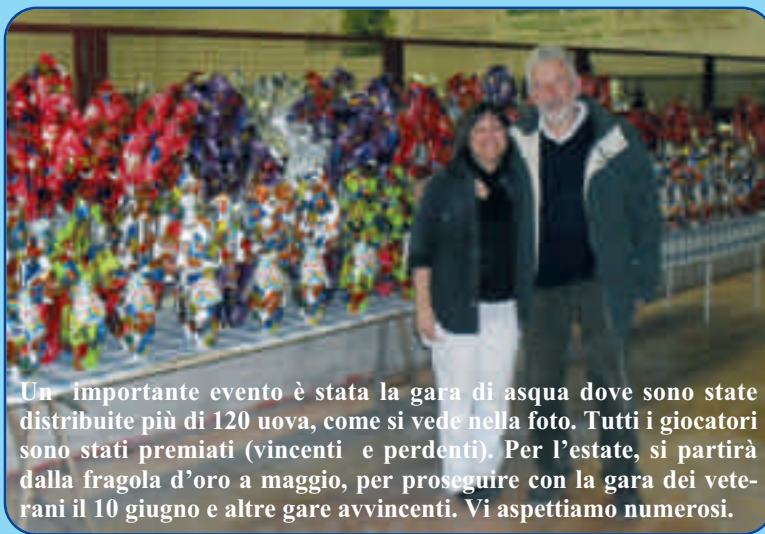
Un importante evento è stata la gara di asqua dove sono state distribuite più di 120 uova, come si vede nella foto. Tutti i giocatori sono stati premiati (vincenti e perdenti). Per l'estate, si partirà dalla fragola d'oro a maggio, per proseguire con la gara dei veterani il 10 giugno e altre gare avvincenti. Vi aspettiamo numerosi.