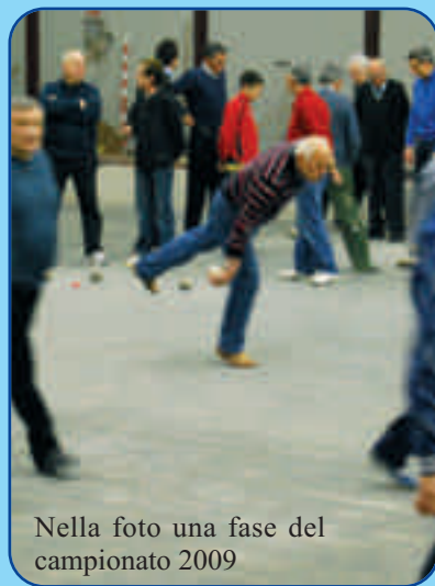
Nella foto una fase del campionato 2009