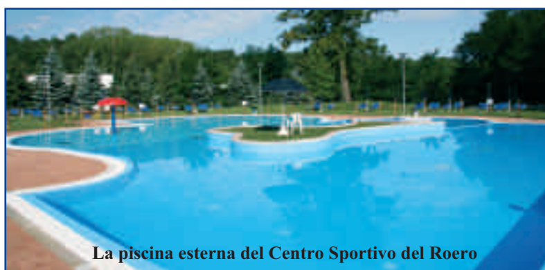
La piscina esterna del Centro Sportivo del Roero

Dal 14 giugno al 16 luglio, infatti, per tutti i bambini delle scuole elementari saranno offerti sport, assistenza e pranzo dalle 8.30 alle 16.30, con possibilità di ingresso anche alle ore 8.00. Ai bambini, di Sommariva Perno e della zona, verranno proposti giochi in acqua nella vasca estiva, tennis, pallavolo, calcio, ginnastica ritmica, giochi di squadra e yoga per i più piccoli al pomeriggio. Seguiti da personale interno qualificato e da allenatori del Centro Sportivo Roero, i bambini, a turni settimanali, avranno la possibilità di provare e di giocare con molti sport e con coetanei, incontrandosi in uno spazio votato allo sport e senza uscire dalla struttura. Verranno inoltre forniti ai bambini i pranzi cucinati al momento e secondo le esigenze