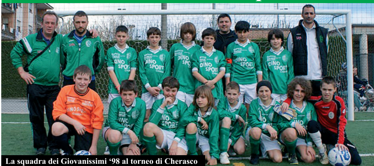
La squadra dei Giovanissimi '98 al torneo di Cherasco

La stagione sportiva 2009-2010 del calcio è terminata all'inizio di maggio. Non si può dire che sia stata una stagione "facile" o "tranquilla" per la nostra Società Sportiva. Ma abbiamo più di un motivo per essere soddisfatti.