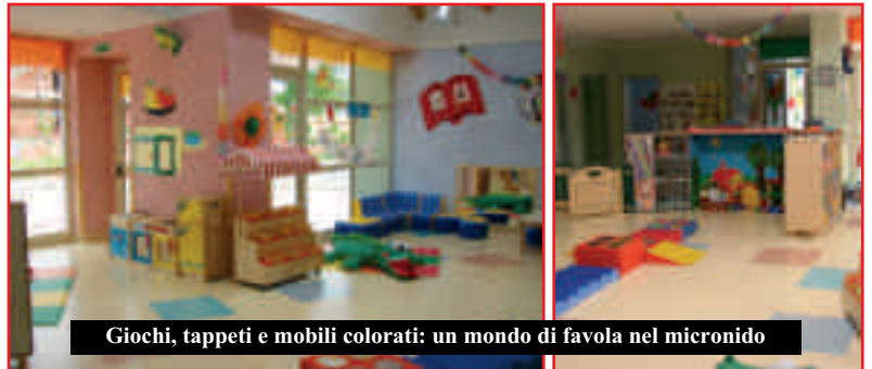
Giochi, tappeti e mobili colorati: un mondo di favola nel micronido

Dopo la "sperimentazione" iniziata nel freddo di gennaio, il micronido s'avvia a cominciare a settembre il suo primo vero anno di attività. I bambini che ne stanno usufruendo (cinque) e le loro famiglie hanno tutti espresso giudizi più che positivi (e ai loro si uniscono quelli del Comune) sulla gestione che la cooperativa Ro&Ro ha interamente affidato a personale di Sommariva Perno, sulle attività didattiche, sui giochi, sulle giornate e su tutti gli sforzi che vengono compiuti per preparare in modo moderno ed adeguato i bambini alla scuola materna.