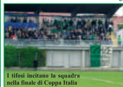
I tifosi incitano la squadra nella finale di Coppa Italia

La Prima Squadra ha portato a termine un campionato di Promozione di assoluto valore; il sesto posto finale non ci ha consentito di arrivare ai play-off, ma ci ha comunque posti tra le più forti compagini di un girone in cui erano presenti squadre di città ben più grandi e titolate. Nel corso del campionato la squadra, se si eccettua un periodo di flessione di risultati che ci ha allontanati dalla vetta della classifica, ha sempre lottato alla pari anche con le avversarie più forti ed ha ottenuto, proprio contro queste, i risultati più brillanti. Ma il vero capolavoro dei giocatori e del mister Lonano è stata la Coppa Italia: per il secondo anno consecutivo siamo giunti alla finale