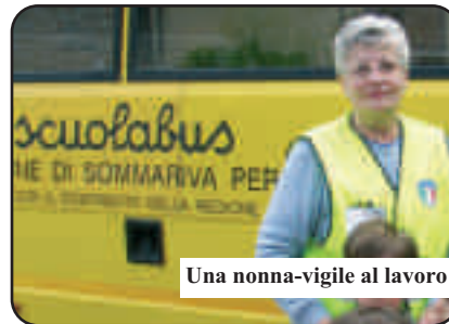
Una nonna-vigile al lavoro

Servizio domiciliare/ospedaliero - Alcuni volontari hanno prestato servizio presso la casa di riposo "Annunziata" due volte alla settimana, intrattenendo gli ospiti e facendo loro un po' di compagnia. Continua anche il servizio di iniezioni a domicilio, che sono state 45.