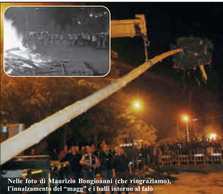
Nelle foto di Maurizio Bongioanni (che ringraziamo), l'innalzamento del "magg" e i balli intorno al falò

Lo chiamano "piantare maggio". E' il rito più antico delle colline, a metà tra la festa campestre e il gesto propiziatorio.