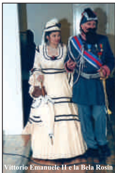
Vittorio Emanuele II e la Bela Rosin

Sabato 29 maggio , alle ore 15.00, sempre in San Bernardino, si vivrà il momento della premiazione del Concorso "Rosafrogola 2010", con apertura di una bellissima mostra dei lavori degli alunni dell'Istituto Comprensivo partecipanti al concorso indetto dall'Amministrazione comunale. Sempre le scuole ci regaleranno, giovedì 3 giugno alle