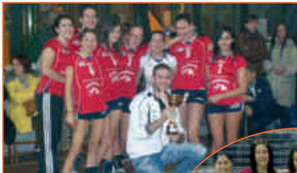
Le Allieve festeggiano la vittoria in due diversi tornei disputati a Castagnole