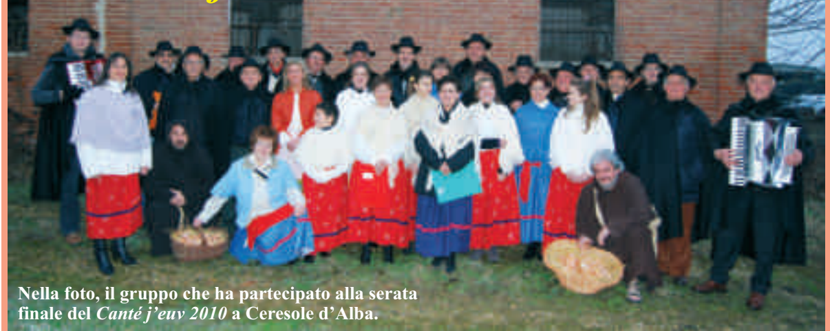
Nella foto, il gruppo che ha partecipato alla serata finale del Canté j'euiv 2010 a Ceresole d'Alba.

Tra febbraio e marzo vie, piazze e contrade di Sommariva Perno hanno rivissuto atmosfere d'altri tempi. Un gruppo di una trentina di persone ha voluto infatti far rinascere il Canté j'euiv, una tradizione da anni dimenticata nel nostro paese, ma non nel Roero. Tra nenie e canti popolari, fratacchioni e "dolci donzelle", questuanti, canterini e suonatori, tutti splendidamente abbigliati, hanno bussato a porte e portoni, in paese come nelle frazioni, cantando i ritornelli tipici della "questua delle uova". L'accoglienza è stata sempre calda, tra curiosità e amarcord. Ogni famiglia o borgo "visitati" si