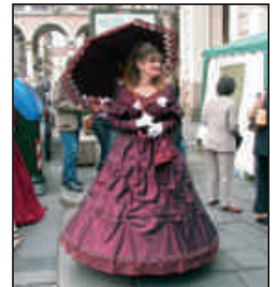
Un altro personaggio del gruppo "La Bela Rosin"