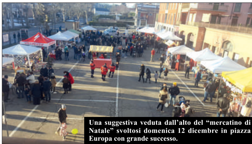
Una suggestiva veduta dall'alto del "mercatinò di Natale" svoltosi domenica 12 dicembre in piazza Europa con grande successo.

Sarà un 2022 ricco di appuntamenti, pandemia permettendo naturalmente. Le proposte che verranno avanzate siamo certi incontreranno il gradimento di tutti i sommarivesi e non solo, perché ce n'è veramente per tutti i gusti. La novità importante e per certi aspetti "rivoluzionaria" è che a presentarle, in un calendario veramente "intrigante", sono le quattro associazioni che da sempre si occupano della animazione socio-turistica-culturale del capoluogo e delle frazioni. Quest'anno però lo faranno "insieme". In stretta collaborazione con il Comune, che metterà a disposizione strutture, uomini e mezzi, la Pro Loco, le Acli di San Giuseppe e di Valle Rossi e il Centro culturale San Bernardino hanno infatti stilato un programma di massima che vede un interscambio continuo tra di loro per offrire a tutti proposte di alto livello, ottimizzando risorse umane e finanziarie.