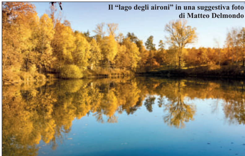
Il "lago degli aironi" in una suggestiva foto di Matteo Delmondo