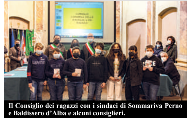
Il Consiglio dei ragazzi con i sindaci di Sommariva Perno e Baldissero d'Alba e alcuni consiglieri.