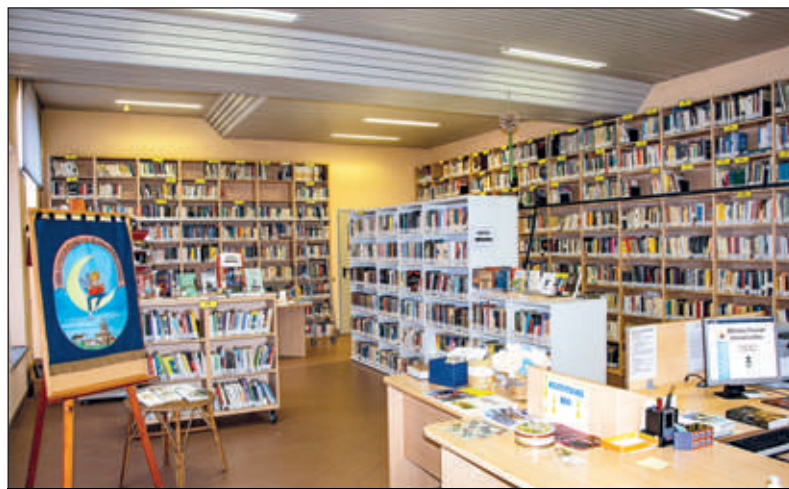
La sala grande della biblioteca con il nuovo allestimento.

Le lettrici sono risultate 239 (276 l'anno precedente) cioè il 60,35% contro il 56,90% dell'anno precedente e 157 i maschi (erano stati 210, cioè il 39,65 contro il 43,10%). Quarantuno sono stati i nuovi iscritti durante l'anno, per un totale di 2127 utenti registrati da quando funziona il sistema informatico in biblioteca, con un calo "fisiologico" di 21 unità rispetto al 2020. Duecentoquindici sono risultati i lettori da zero a 19 anni (118 femmine e 97 maschi). I numeri sono alti proprio grazie alle "scatole delle meraviglie" piene di libri che sono state