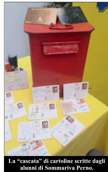
La "cascata" di cartoline scritte dagli alunni di Sommariva Perno.