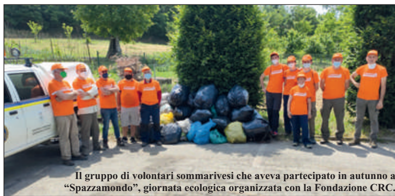
Il gruppo di volontari sommarivesi che aveva partecipato in autunno a "Spazzamondo", giornata ecologica organizzata con la Fondazione CRC.