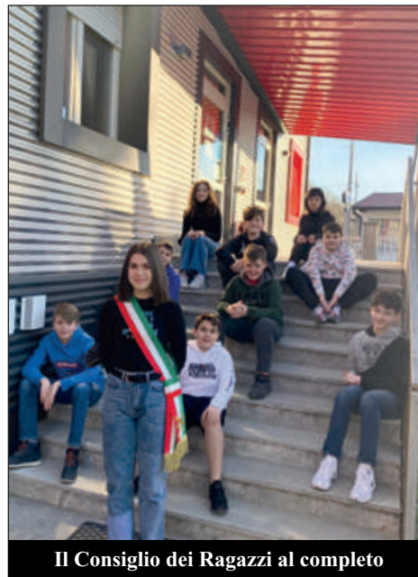
Il Consiglio dei Ragazzi al completo

Il progetto vincente di quest'anno è stato quello della lista chiamata Give me five , che ha ottenuto più voti rispetto alla lista Insieme possiamo farcela , che pure