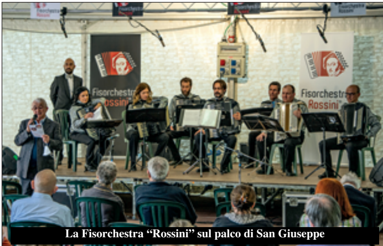
La Fisorchestra "Rossini" sul palco di San Giuseppe