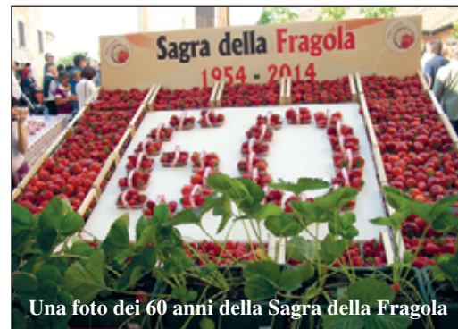
Una foto dei 60 anni della Sagra della Fragola

2020 a causa del Covid) ha sempre voluto e vuole rendere onore a quei pionieri che seppero "inventare" un futuro, dando speranza e portando ricchezza alle nostre colline fino ad allora aride e povere. Lo fa anche nel 2022, dopo due anni di grandi tribolazioni e chiusure, nei quali però "il posto delle fragole" in piazza Europa è stato comunque segno di speranza e di ripresa. Lo fa non per uno sterile amarcord, ma per continuare a far rivivere l'entusiasmo e la voglia di nuovo che animarono i "pionieri" e che possono essere lo stimolo, coniugato al presente, per un futuro ancora possibile per tanti giovani e tante famiglie.