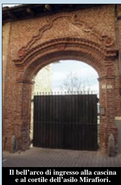
Il bell'arco di ingresso alla cascina e al cortile dell'asilo Miraffiori.