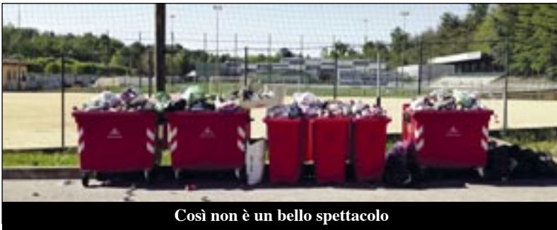
Così non è un bello spettacolo

Era stato istituito dal CoABSER, cioè il Consorzio Albese Braidese Servizio Rifiuti, come esperimento per rispondere alle richieste di chi “non sapeva dove mettere le scatolette” e soprattutto per venire incontro alle esigenze di coloro che, avendo animali in casa, producono molte lattine di metallo. I cassonetti rossi per un po’ hanno funzionato e sono stati un servizio in più. Adesso, però, funzionano... troppo, perché richiamano utenti dai paesi vicini, sprovvisti del servizio. Questo porta ad un sottodimensionamento dei sei cassonetti disponibili in loc. Galano, che si riempiono molto in fretta e debordano, offrendo uno spettacolo indecoroso e venendo meno al loro scopo. Per questo motivo, non essendo possibile ampliare a tutti i Comuni il servizio dei “cassonetti rossi”, per ovvi motivi di costi che andrebbero ad aumentare le tariffe a carico di tutti i contribuenti, sempre il CoABSER, ha deciso che il servizio cesserà dal prossimo 22 maggio e i cassonetti saranno rimossi. Le lattine dovranno essere portate nei più vicini Centri di raccolta (Pocapaglia o Monticello) oppure inserite nei sacchetti bianchi dell’indifferenziata per il conferimento al centro di preselezione di Sommariva del Bosco dove saranno recuperate con l’altro metallo presente nei sacchetti bianchi.