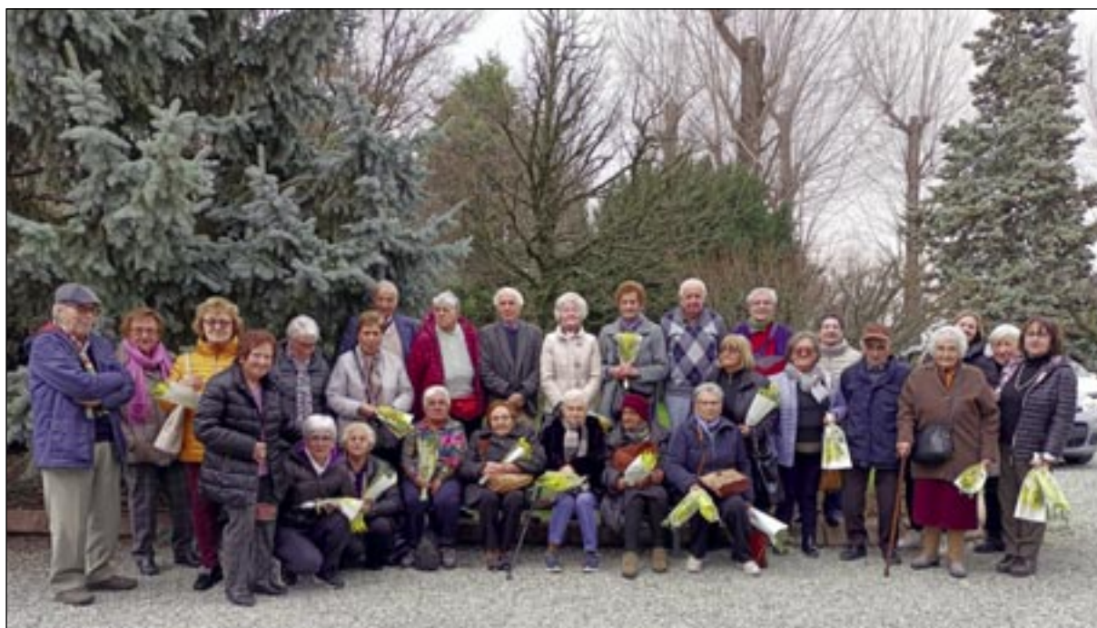
Il folto gruppo dei partecipanti a una delle tante iniziative organizzate dal gruppo Ven co ti .

Il "Progetto Cocoon", come riportato su Il Perno di dicembre, ha iniziato l'anno sociale 2022/2023 a settembre, con una giornata importante dedicata a tutti i partecipanti al progetto dei diversi Comuni coinvolti nei 20 anni di attività sul territorio.