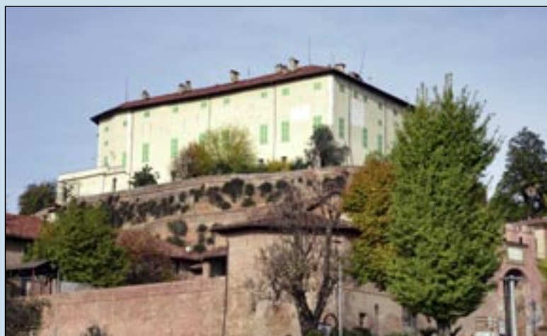
Tutto il complesso di castello e pertinenze restaurato nel 2022. A destra, l'Arco di Vittorio Emanuele II.