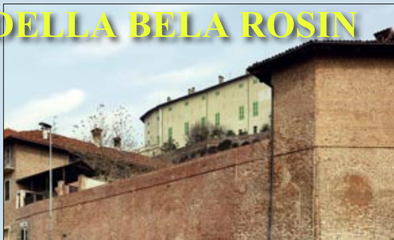
Un angolo della cascina del conte, il possente muraglione su via Alba e, a sinistra, l'asilo Miraffiori.