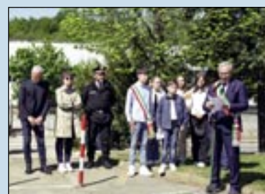
Il sindaco mentre pronuncia il discorso pubblicato integralmente a lato

Il 25 aprile è dunque la festa della liberazione di TUTTI gli italiani. E' la festa degli italiani che seppero scegliere, di quelli che non ebbero il coraggio di farlo e anche di coloro che scelsero in modo errato, ma che poi, comunque, si rimboccarono le maniche e contribuirono a ricostruire quello che l'Italia aveva perso: l'unità, la patria, la libertà. E' una festa che celebriamo qui al Ponte del Galano, perché qui il 14 aprile del '45, qualche giorno prima della Liberazione, vi fu una importante battaglia tra le forze partigiane e un contingente di militi della X MAS provenienti da Bra. Erano italiani sia gli uni sia gli altri: da una parte quelli che avevano aderito alla repubblica di Salò e quindi avevano seguito le idee dell'Italia fascista; dall'altra quelli che avevano scelto di combattere e resistere, come partigiani, contro il nazifascismo e l'occupazione tedesca.