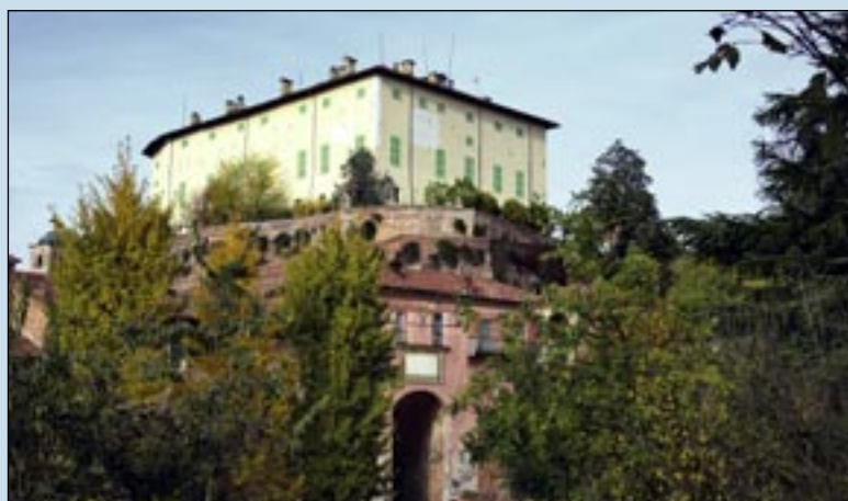
Uno scatto dalla "collina del conte", con l'arco in primo piano.

Altre belle immagini per concludere la carrellata iniziata sul numero di marzo de Il Perno per testimoniare il grande intervento fatto lo scorso anno sul castello di Miraffiori e sugli immobili che ne sono corona. Un vero "gioiello ritrovato" per il nostro paese, di cui Sommariva Perno è grata alla famiglia Gromis di Trana.