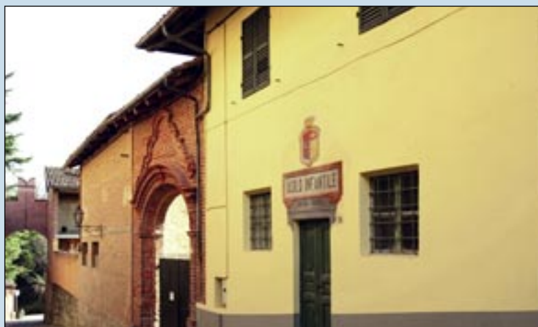
L'ingresso della "cascina del conte" e dell'Asilo Miraffiori in Via Vittorio Emanuele II.

Altre belle immagini per concludere la carrellata iniziata sul numero di marzo de Il Perno per testimoniare il grande intervento fatto lo scorso anno sul castello di Miraffiori e sugli immobili che ne sono corona. Un vero "gioiello ritrovato" per il nostro paese, di cui Sommariva Perno è grata alla famiglia Gromis di Trana.