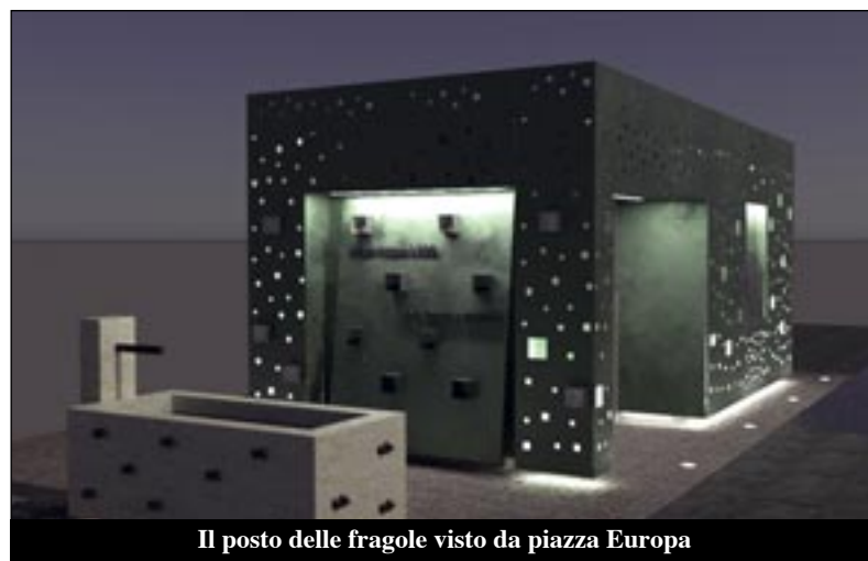
Il posto delle fragole visto da piazza Europa

L' Aiatta , infine. La scommessa vincente di un gruppo di sommarivesi, agricoltori e non, che con intelligenza e lungimiranza hanno portato in buona parte del territorio comunale l'"oro blu" che sgorga dalle profondità della terra per vincere la sete d'acqua delle nostre aride colline e consente alla "regina" dei nostri bricchi di continua-