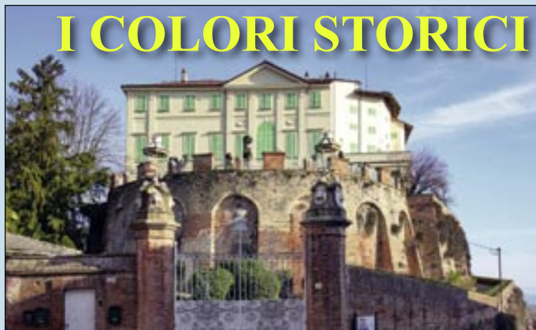
L'imponente mole del castello con i suoi bastioni secolari e il bel portone di accesso.