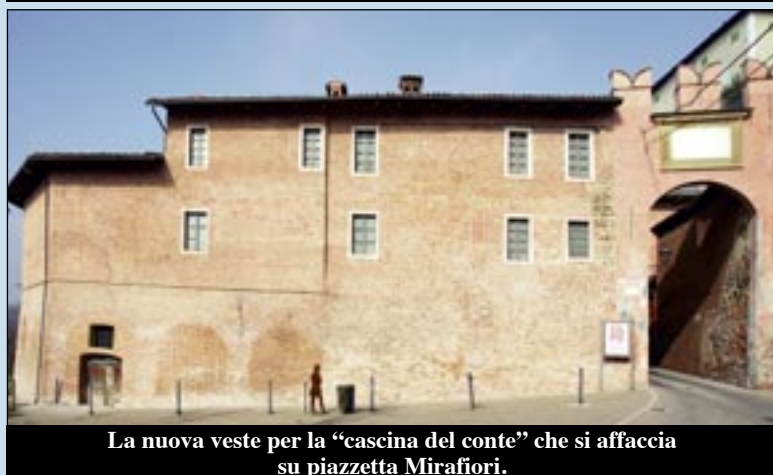
La nuova veste per la "cascina del conte" che si affaccia su piazzetta Miraffiori.