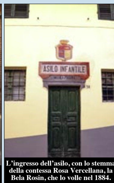
L'ingresso dell'asilo, con lo stemma della contessa Rosa Vercellana, la Bela Rosin, che lo volle nel 1884.