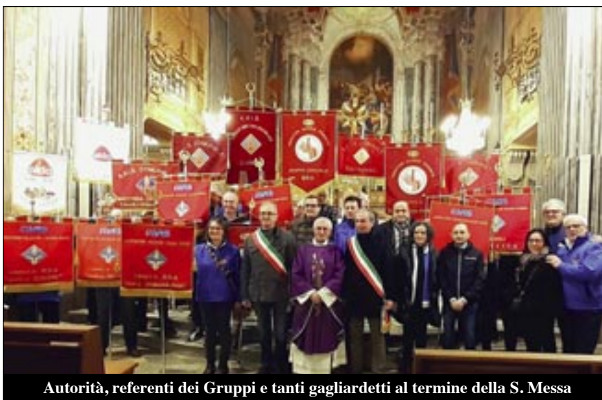
Autorità, referenti dei Gruppi e tanti gagliardetti al termine della S. Messa