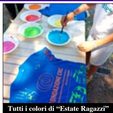
Tutti i colori di "Estate Ragazzi"

Progetto "Nonni Vigili" - A settembre 2022 è ripartito anche il servizio dei "Nonni Vigili" sullo scuolabus per accompagnare i bambini della scuola materna e primaria; 17 i