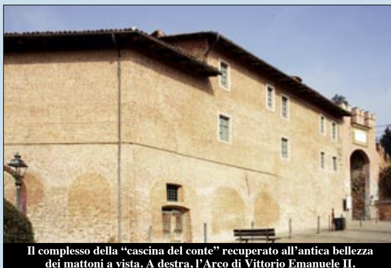
Il complesso della "cascina del conte" recuperato all'antica bellezza dei mattoni a vista. A destra, l'Arco di Vittorio Emanuele II.