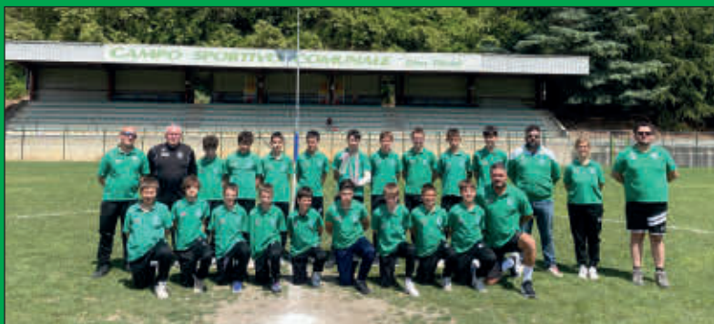
I Giovanissimi 2025/2026