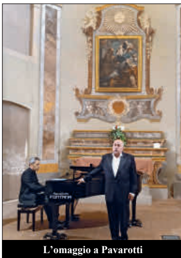
L'omaggio a Pavarotti