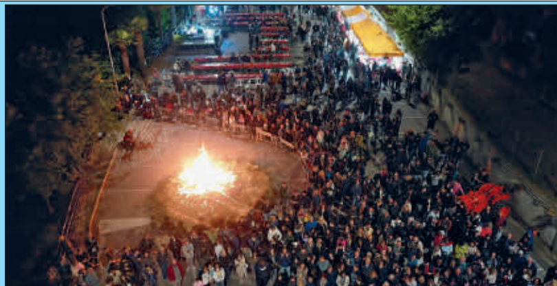
Un mare di gente per lo spettacolo dell'innalzamento del magg , il falò e i fuochi d'artificio in piazza Zio John

Ancora una volta dunque la primavera a Sommariva Perno ha avuto il profumo della terra e il sapore delle tradizioni antiche. A San Giuseppe si è rinnovato come ogni anno il suggestivo rito del Pianté Magg , il tradizionale innalzamento dell'albero di maggio che da secoli simboleggia il risveglio della natura, la fertilità e la forza della vita.