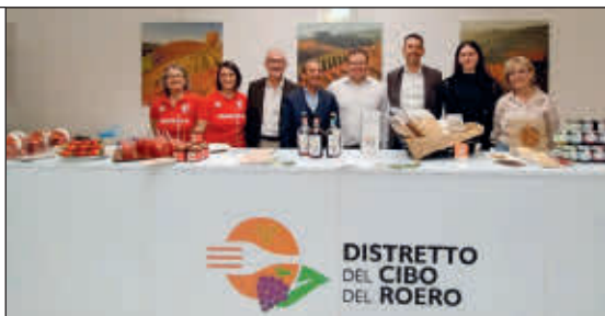
Le fragole di Sommariva Perno a Vinum

Una "vetrina" speciale per la fragola di Sommariva Perno: domenica 26 aprile la "rossa" delle nostre colline è stata infatti messa in bella mostra a Vinum , la manifestazione internazionale di Alba. Le rappresentanti del "Consorzio di Tutela e Valorizzazione della Fragola di Sommariva Perno nel Roero" hanno potuto "raccontare" a centinaia di visitatori le grandi qualità del prodotto principe sommarive-