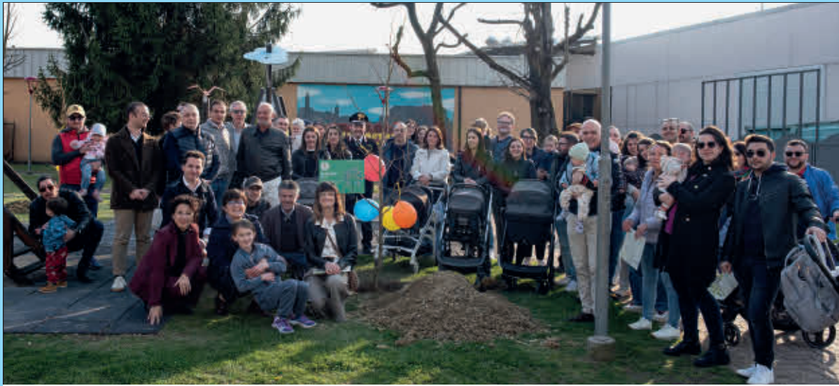
Autorità e tante famiglie per una bella giornata di festa presso il giardino di Via Roma

Sabato 21 marzo l'Amministrazione Comunale ha voluto festeggiare l'inizio della primavera con