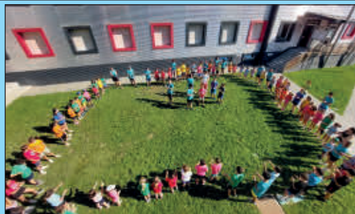
Pronti a vivere nuove avventure

E' in programma dal 15 giugno al 4 settembre la nuova stagione di "Estate Ragazzi", gestita dalla cooperativa Il Pianeta di Alba, cui il Comune ha affidato l'incarico. Sarà un'estate diversa da quelle che per anni hanno riempito i mesi estivi per decine di bambini, ragazzi e adolescenti sommarivesi. Un'estate "olimpica", perché molto incentrata sulle attività sportive. La cooperativa è infatti specializzata in questo tipo di proposte. I partecipanti potranno quindi sperimentare tutti i tipi di sport (nuoto, tennis, baseball, volley, atletica, arrampicata in palestra, arti marziali...), partecipare a laboratori multimediali, creativi e anche linguistici. Non mancheranno naturalmente le giornate dedicate al trekking e alle gite, con lezioni di mountain bike. Ci sarà ovviamente (per la gioia dei ragazzi e sollievo delle famiglie) il momento dei compiti.