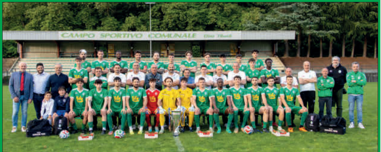
Gli sponsor e il sindaco, i giocatori, gli allenatori, i dirigenti accompagnatori e lo staff della Prima Squadra dell'USD Sommariva Perno che si è aggiudicata la COPPA ITALIA PROMOZIONE PIEMONTE 2025/2026

Se la Prima Squadra brilla, la società non distoglie lo sguardo