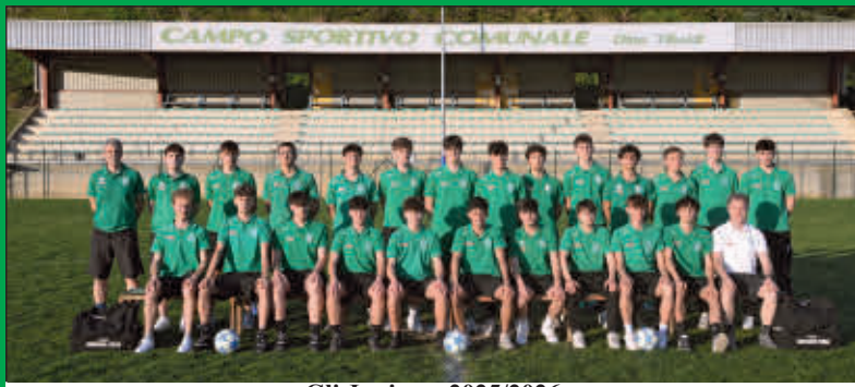
Gli Juniores 2025/2026