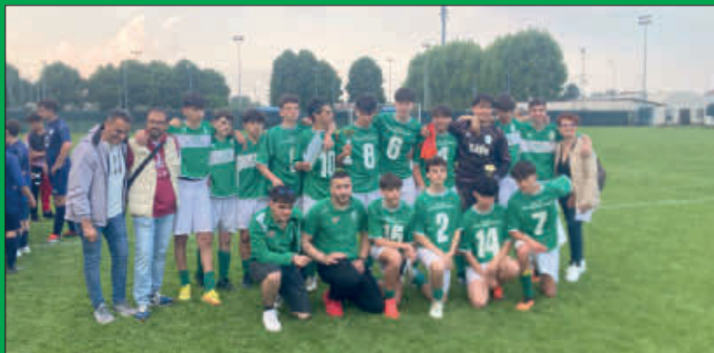
Gli Allievi 2025/2026