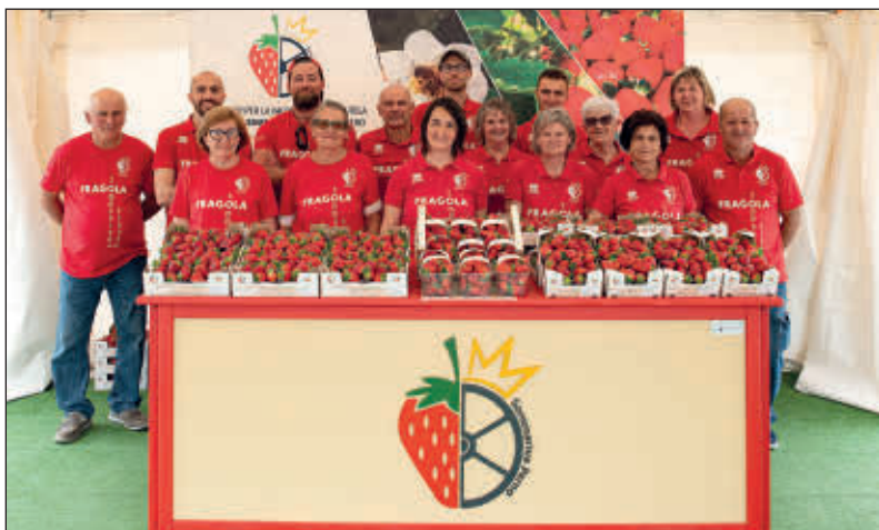
Alcuni dei produttori aderenti al Consorzio dietro il bancone con stemma che impreziosisce "Il posto delle fragole" in piazza Europa

Sono, però, a modo loro, valvole di serenità nel mezzo di una terra avara, spesso crudele, a volte triste, e restano risorsa di ragionevolezza in un mondo in fiamme nel quale volano droni, missili, bombe e carrellate di insulti. E' vero: non ci sono più le stagioni e le fragole si trovano tutto l'anno, però non quelle del Roero che, con la loro naturalezza, ricordano i tempi ("ogni cosa alla sua stagione") e i contorni di una vita che non c'è più. Possono ridarci il respiro innocente che nella loro sagra è gioia, sorriso, soprattutto speranza in un mondo che sente il bisogno