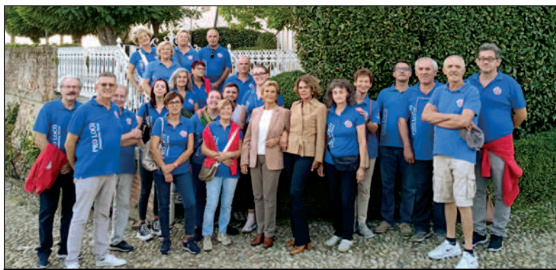
La "vecchia" Pro Loco quasi al completo in visita in castello l'anno scorso

Con l'assemblea straordinaria di lunedì 29 luglio è scaduto naturalmente il mandato triennale del Direttivo Pro Loco di cui sono stato presidente. Come tutte le cose che finiscono, resta un po' di tristezza, ma anche la consapevolezza che l'impegno stava diventando troppo gravoso per un gruppo valido, ma ridotto come il nostro. Quindi è arrivato il momento delle valutazioni e dei ringraziamenti. Valutazioni secondo me abbastanza positive: in questi tre anni abbiamo gestito il "posto delle fragole" in collaborazione con i produttori, tre edizioni della Sagra della Fragola, la manifestazione da Ciabot a Ciabot , la festa patronale di Santa Croce, il mercatino di Natale, Pro Loco in città, Cantè j'euiv , Pianté Magg e lasciamo a disposizione del nuovo Direttivo della Pro Loco € 7800. Si poteva fare di più? Sinceramente sì. Si poteva fare meglio? Decisamente sì. Ma noi ce l'abbiamo veramente messa tutta e quello