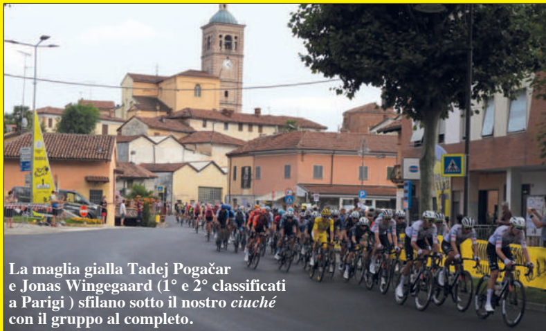
La maglia gialla Tadej Pogačar e Jonas Vingegaard (1° e 2° classificati a Parigi) sfilano sotto il nostro ciuché con il gruppo al completo.