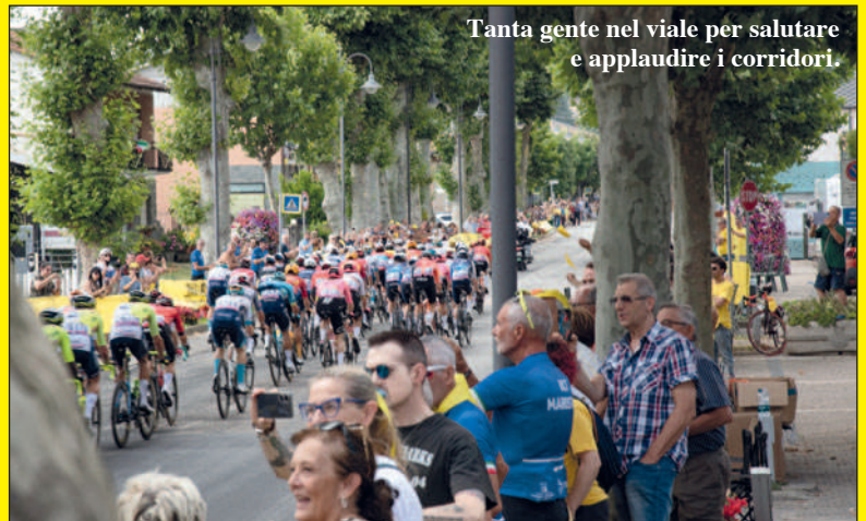
Tanta gente nel viale per salutare e applaudire i corridori.