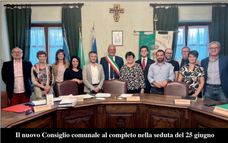
Il nuovo Consiglio comunale al completo nella seduta del 25 giugno

Il sindaco ha provveduto alla nomina degli assessori, assegnando le deleghe ai due componenti dell'Esecutivo previsti dalla legge. Per allargare il più possibile la squadra "di governo", ha assegnato poi altri incarichi, coinvolgendo tutti i consiglieri con deleghe specifiche. Ecco dunque l'organigramma completo della Giunta e dell'Amministrazione per il quinquennio 2024-2028.