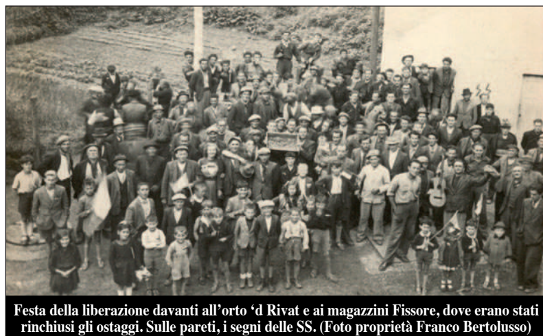
Festa della liberazione davanti all'orto 'd Rivat e ai magazzini Fissore, dove erano stati rinchiusi gli ostaggi. Sulle pareti, i segni delle SS.