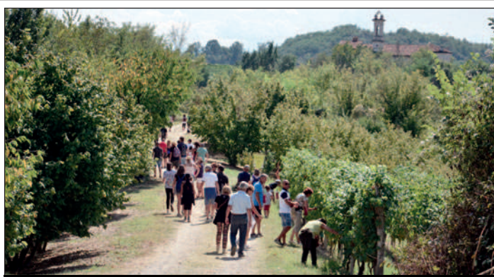
Nelle immagini di repertorio, i due momenti tipici del settembre sommarivese: "Da ciabòt a ciabòt" e la "polentata"

Domenica 22 settembre , si comincerà al mattino, e si andrà avanti fino a sera, sotto i platani del viale con i mercatini degli hobbisti e dell'artigianato ; alle 11.15 è prevista l' inaugurazione del nuovo campo sportivo in loc. Galano; si proseguirà poi con il pranzo dei "giovani anziani" e, nel pomeriggio, in piazza Europa,