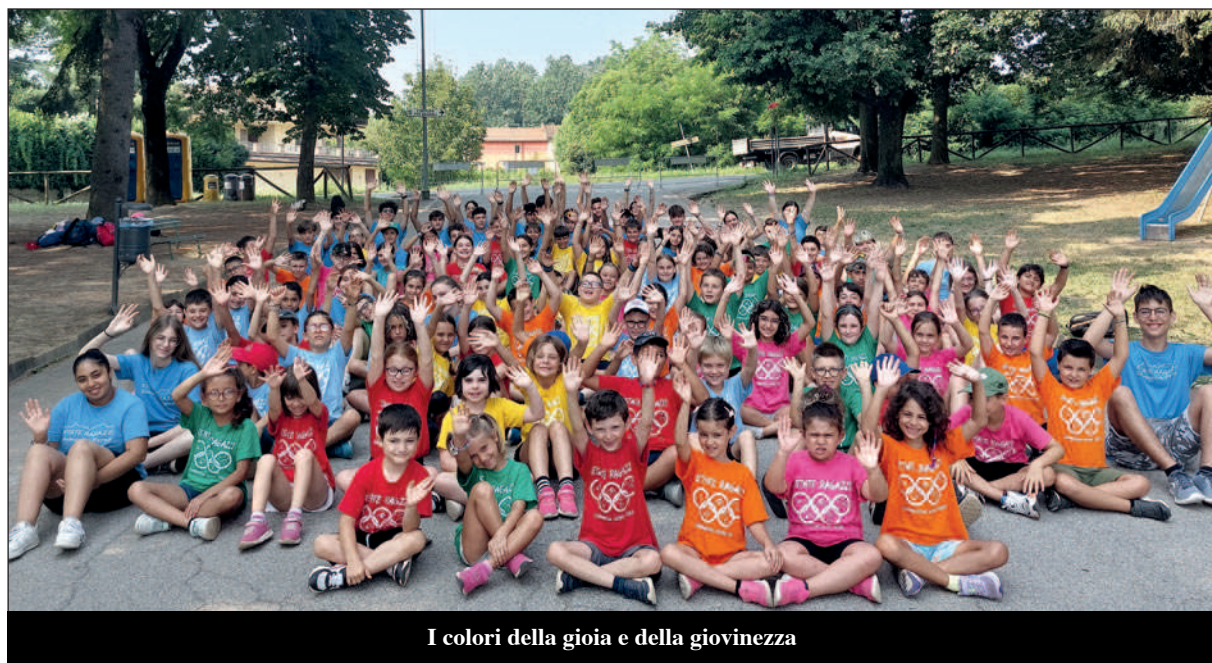
I colori della gioia e della giovinezza

All'Istituto Comprensivo e all'Amministrazione comunale va il grazie