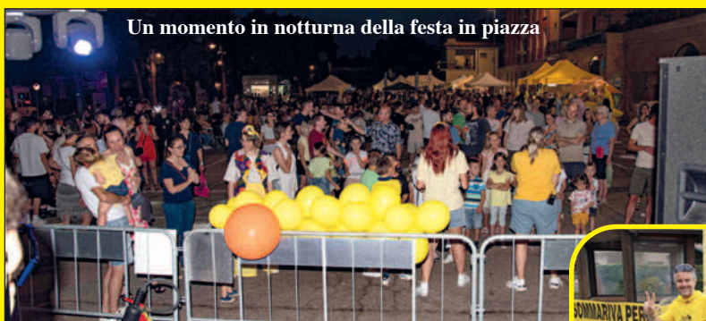
Un momento in notturna della festa in piazza