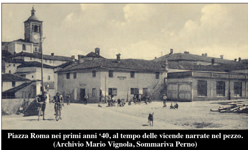
Piazza Roma nei primi anni '40, al tempo delle vicende narrate nel pezzo.

zione annunciata. I tedeschi se ne vanno la sera del 3 luglio, lasciandosi dietro case saccheggiate ed incendiate, numerosi feriti, e portando via una ventina di prigionieri destinati nei campi di concentramento in Germania. Ma non è finita, perché quel "mercato" di cui parla Mons. Grassi ci fu effettivamente, testimoniato da varie voci. Tedeschi e fascisti tornano infatti altre volte a Sommariva Perno (il 4 e 7 luglio; il 13 addirittura con una colonna di 17 camion), sempre con la minaccia di distruggerlo fino a che i sommarivesi non sborseranno una somma enorme per quei tempi (la richiesta iniziale è di 210.000 lire!) per liberare il paese. I tedeschi "visitano" infatti Sommariva Perno per l'ultima volta il 30 luglio del '44, nuovamente accompagnati dai fascisti. Il comandante