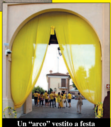
Un "arco" vestito a festa