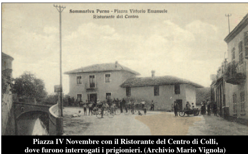
Piazza IV Novembre con il Ristorante del Centro di Colli, dove furono interrogati i prigionieri.