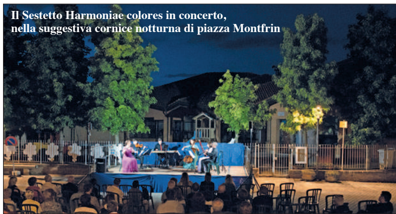
Il Sestetto Harmoniae colores in concerto, nella suggestiva cornice notturna di piazza Montfrin

Bela Rosin 2024", organizzata dal Centro culturale con il contributo delle Fondazioni CRC e CRT e in collaborazione con il Comune, la Pro Loco, le Acli di San Giuseppe e Valle Rossi e supportate come sempre dal Gruppo Carabinieri in congedo.