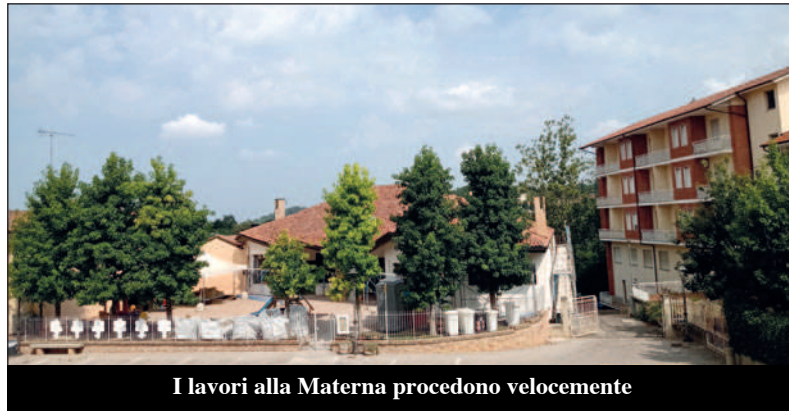
I lavori alla Materna procedono velocemente