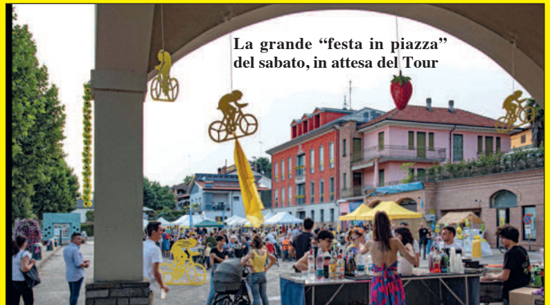
La grande "festa in piazza" del sabato, in attesa del Tour