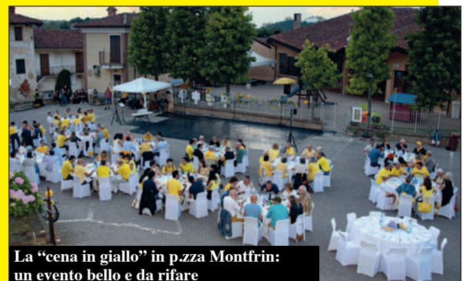
La "cena in giallo" in p.zza Montfrin: un evento bello e da rifare