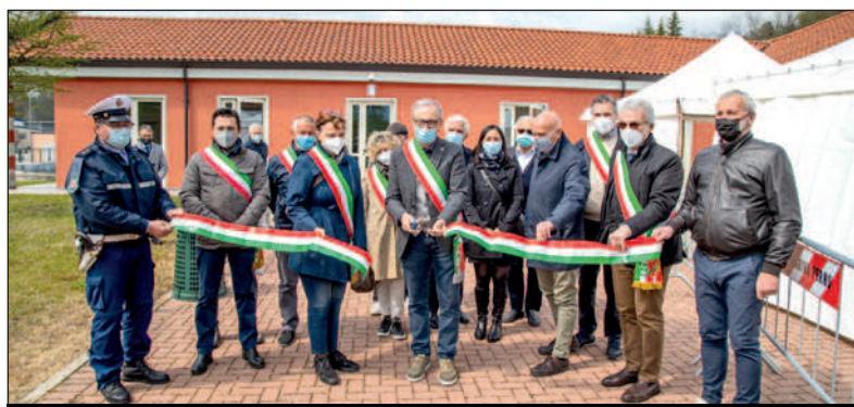
L'inaugurazione del Centro Vaccinale a MondoGiovani: modello a livello provinciale, chi se lo ricorda più?