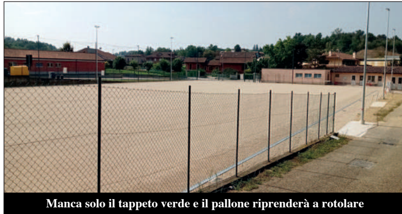
Manca solo il tappeto verde e il pallone riprenderà a rotolare

campionato su un campo finalmente "come si deve", con tappeto in erba artificiale, segnato e attrezzato. Un sogno lungo una vita, che finalmente si avvera!