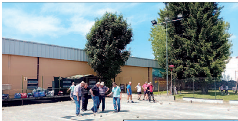
Momenti della gara dei Veterani.

Dopo la gara, giocatori e accompagnatori (circa 190 persone in tutto!) si sono ritrovati presso il Bar del Centro Sportivo del Roero per il pranzo delizioso, terminato con una