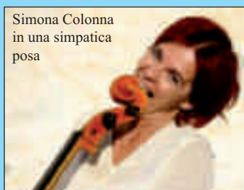
Simona Colonna in una simpatica posa

Sarà la violoncellista Simona Colonna ad inaugurare in San Bernardino le tante iniziative che il Centro culturale propone per il 2013. Venerdì 5 aprile, infatti, la musicista baldisserese, artista ormai affermata a livello internazionale, presenterà Masca vola via , un concerto sicuramente "intrigante", perché composto da canzoni da lei scritte e cantate rigorosamente in piemontese, che raccontano di storie e personaggi della nostra terra. Simona regalerà a Sommariva