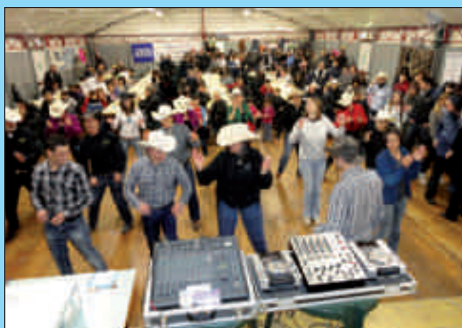
Due momenti particolarmente intensi di San Giuseppe 2012.