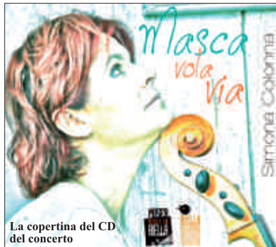
La copertina del CD del concerto

anche qualcuno in più) per gustare storia, arte, letteratura. Si comincia domenica 17 marzo (partenza alle ore 14,30 da piazza Marconi) per andare... Sulle tracce della Sommariva Perno antica . Faremo insieme una semplice camminata "da banda 'd suta" alla ricerca di Perno (l'antica Paternum) descritta