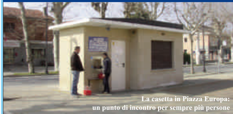
La casetta in Piazza Europa: un punto di incontro per sempre più persone

Straordinario successo della "fontana del sindaco". Chi l'avrebbe mai previsto. Dal giorno dell'apertura, otto dicembre 2012, al 31 gennaio 2013 sono state erogate 7534 bottiglie, tre per ogni abitante. Lo dice l'azienda che gestisce il servizio ed ognuno di noi può controllare sul sito www.acquaequa.com . E siamo d'inverno. Figuriamoci d'estate. L'amministrazione, e il sindaco Simone Torasso in particolare, non possono che essere soddisfatti di una scelta così apprezzata e considerata, una scelta di servizio pubblico: comoda, a costi più che contenuti, ecologica.