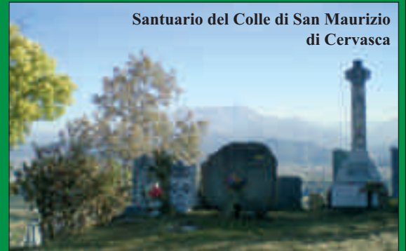
Santuario del Colle di San Maurizio di Cervasca