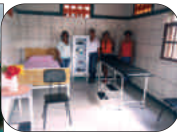
La nuova infermeria costruita ed attrezzata con i soldi di Cantè j'euiv