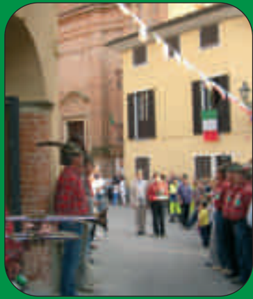
Inaugurazione della sede in Via Ala

Ma ora un nuovo anno ricco di impegni si apre davanti a noi e già sono pronto a ritrovare i miei amici. Per questo, caro Socio, ti allego i principali appuntamenti del 2013: io sarò presente a tutti, come mia felice abitudine, e sono certo di poter partecipare con te ad alcuni preziosi momenti di ricordo e amicizia. Metto una foto di dove abito: qui ti aspetto tutti i primi martedì del mese alle 20,45 per un bicchiere e quattro chiacchiere.